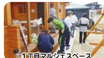
1丁目マルシェスペース GALLERYCHILLOUTSPACE見学