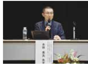
◀「多様性を認め合い誰もが暮らしやすい池田町を目指して」をテーマに開催し、信州大学医学部子ども発達医学教室教授本田秀夫先生の講演会を行いました。