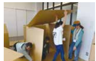
▶「ふるさとチャレンジ塾」キャンプで段ボールハウス作り