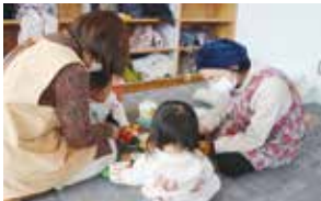
◀「ファミリー・サポート・センター協力会員による一時預かりの様子