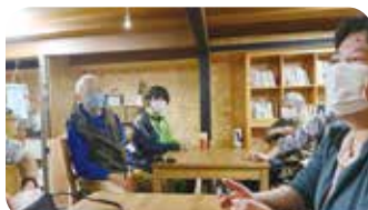
Caféからびなでハーブティトーク

4月26日(金)連絡会のメンバーで、見慣れた池田のまちなみから“新しい集いの場発見”を目的に、町内をまち歩きしました。 ※一緒にボランティア活動を盛り上げてくださる方や団体を随時募集しています。